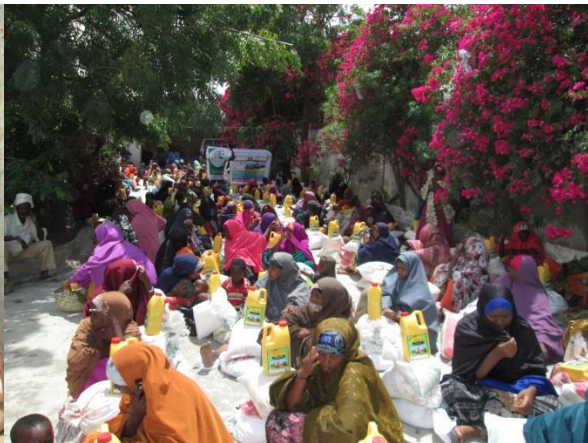
Familien mit deren Essenspaketen, Mogadishu, 2013