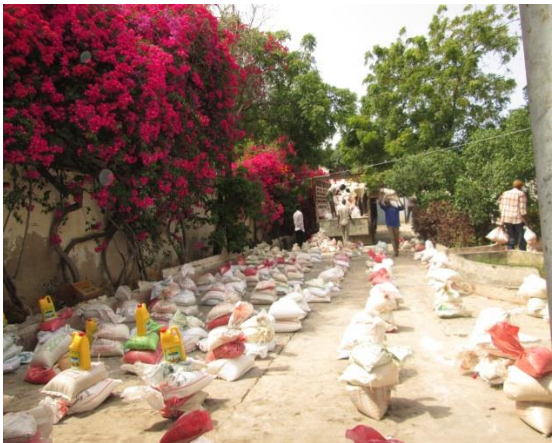
Familienpakete, Mogadishu, 2013

Auch im Jahre 2013 organisierte das Somalische Komitee einige Projekte, die mithilfe der Spendengelder realisiert werden konnten. Zahlreiche Menschen in Somalia profitieren bis heute hin von den Erfolgen unserer Initiativen und Bauprojekten. Im April 2012 begannen wir in Kooperation mit Kindertränen mit dem Projekt der Familienpakete . Diese Pakete erreichten sowohl Familien in Mogadishu und Baydhabo als auch in den Dörfern Dinsoor, Sakow und Goobale.